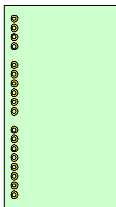
Paso pines 2,54 mm